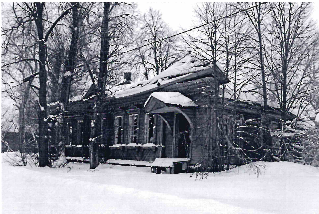
Точка фотофиксации № 1.