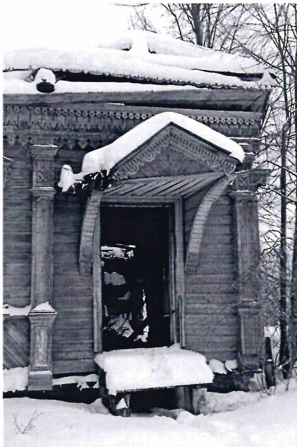
Точка фотофиксации № 4.