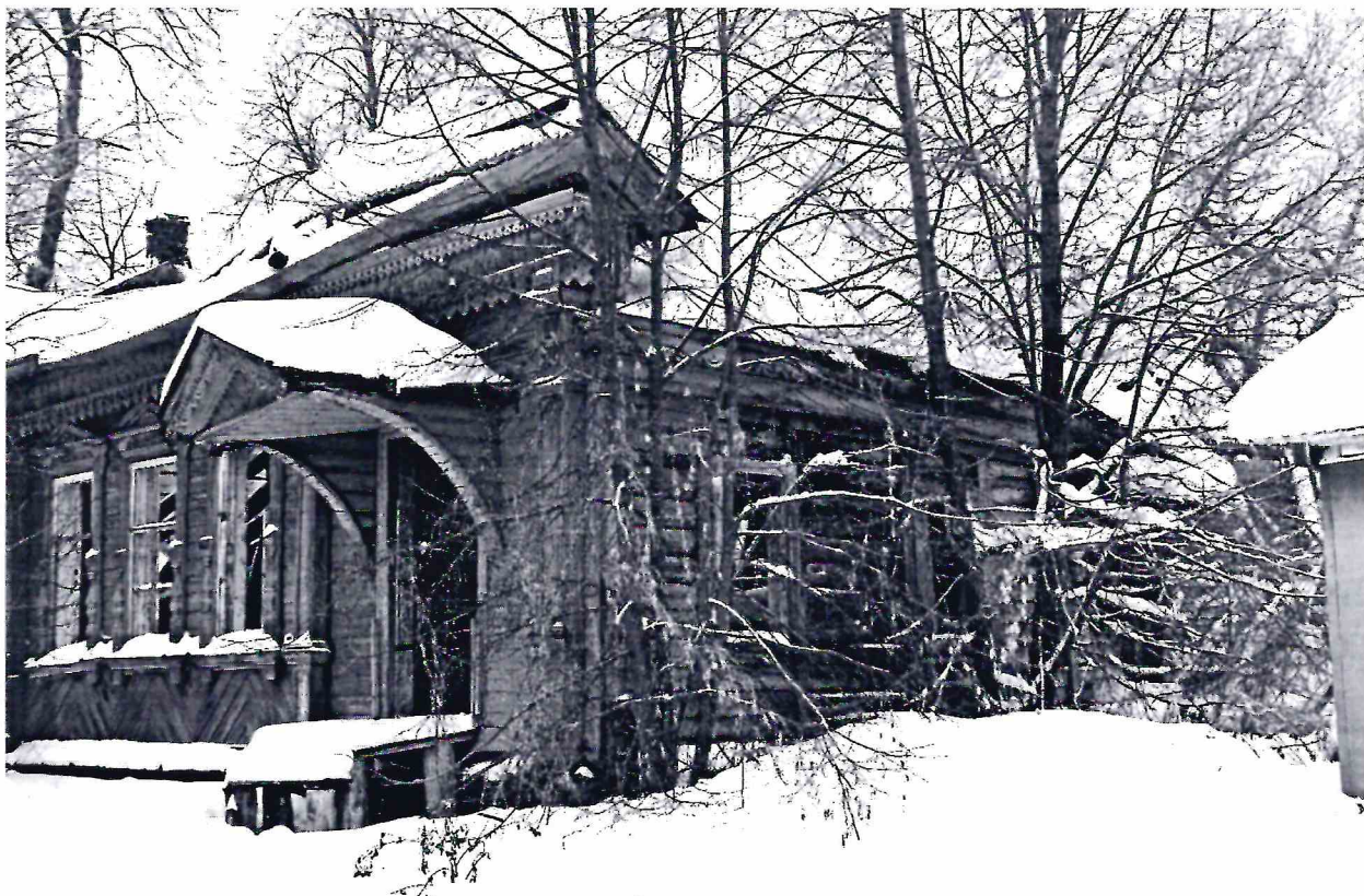
Точка фотофиксации № 2.

Фрагмент фасада с северо-восточной стороны.