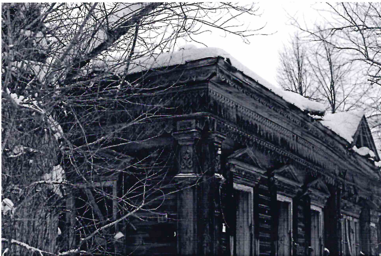
Точка фотофиксации № 8.

Фрагмент фасадов с юго-восточной стороны.