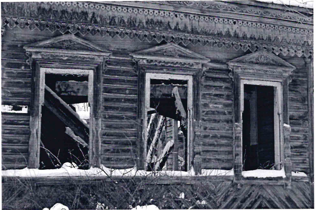
Точка фотофиксации № 6. Фрагмент восточного фасада.