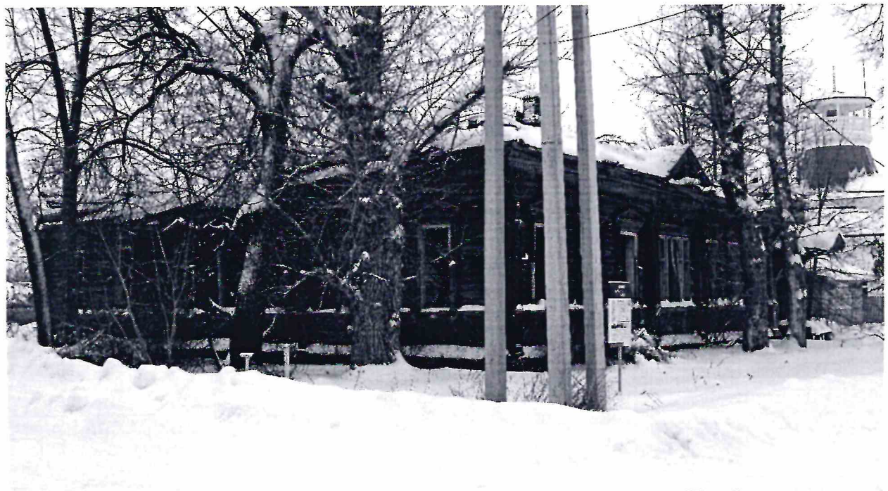
Точка фотофиксации № 7. Общий вид с юго-восточной стороны.