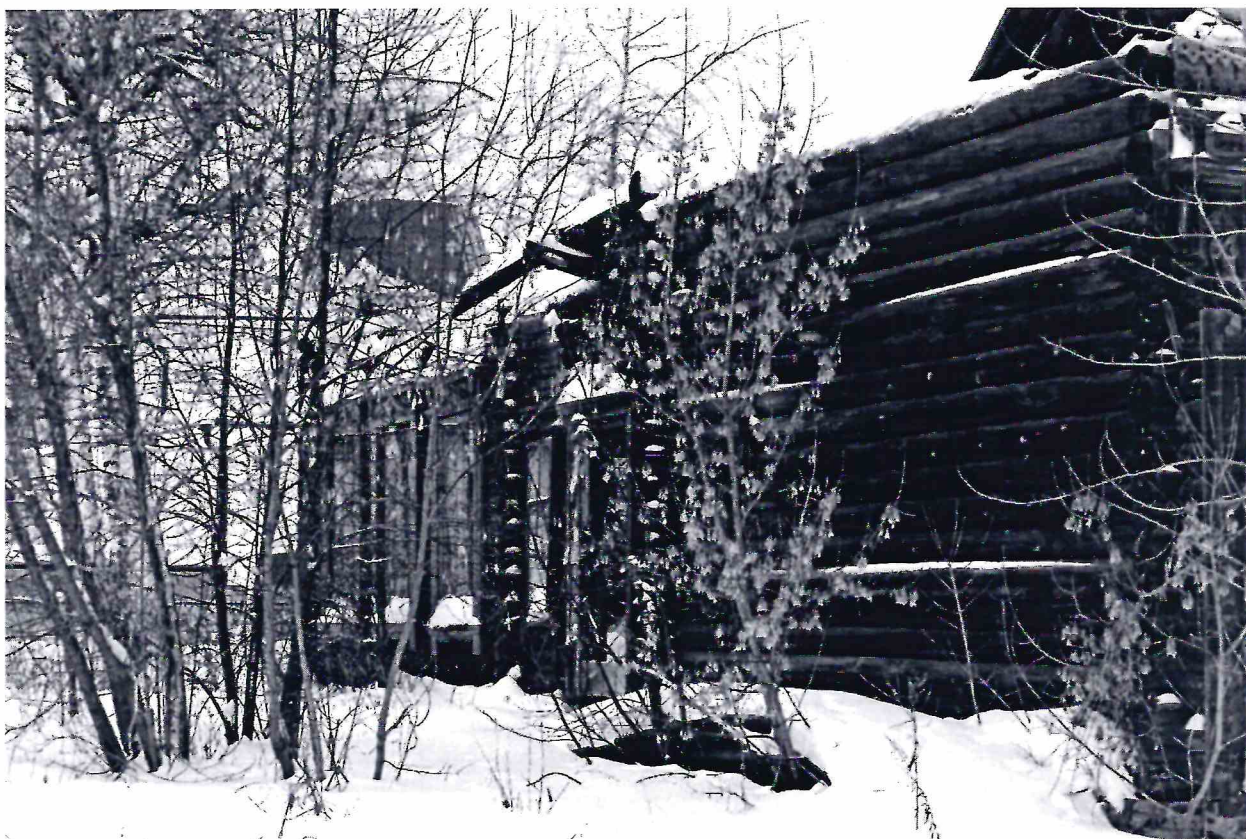
Точка фотофиксации № 12. Фрагмент западного фасада.