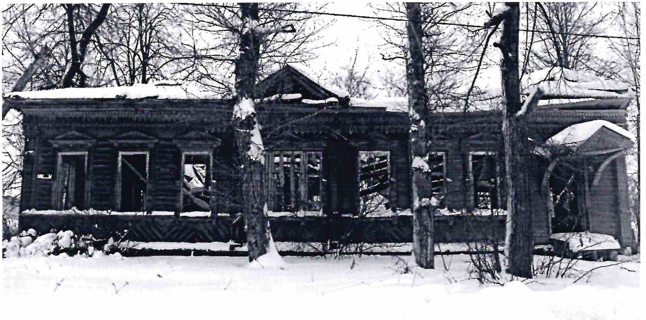
Точка фотофиксации № 3.